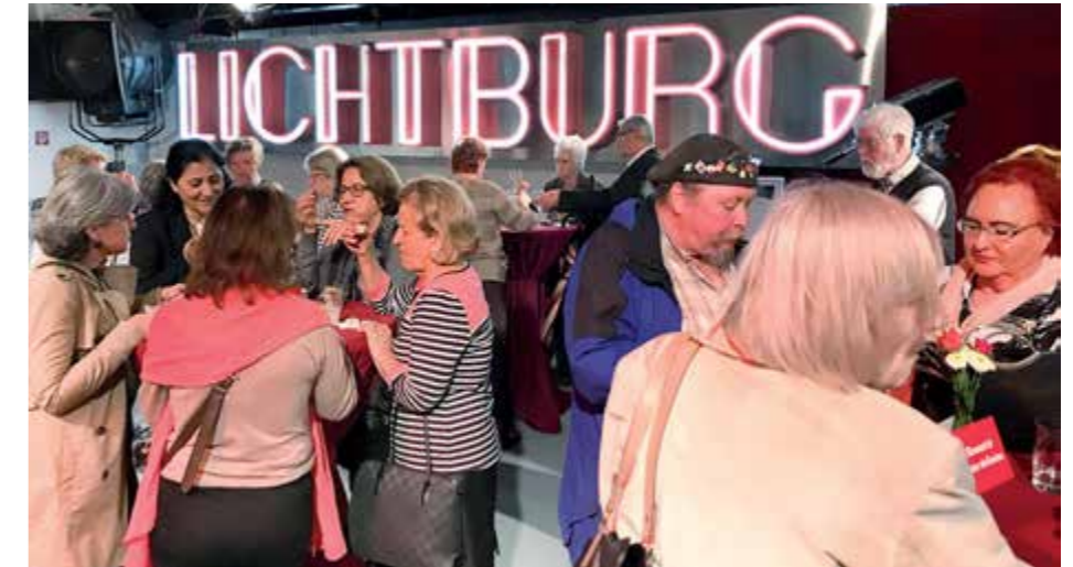
Kino, Klönen, Kartoffelecken und andere Köstlichkeiten – das Ehrenamtsfest traf auch diesmal den Geschmack der Gäste

Nach dem Überraschungsfilm „Hidden Figures“, einem Film über die