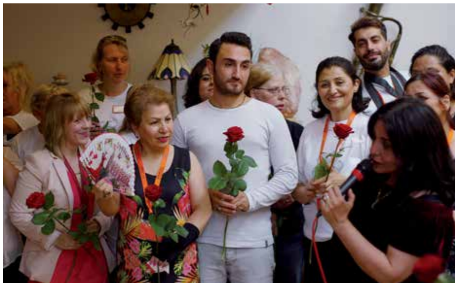
Beim „Fest der Kulturen“ im Hans-Jeratsch-Haus der AWO VITA gGmbH nutzten Jung und Alt die Gelegenheit zur interkulturellen Begegnung.

Die AWO Düsseldorf intensiviert ihre Quartiersarbeit in der Landeshauptstadt. Geplant ist, im Bereich Lierenfeld und Eller ein altersgerechtes Quartier zu entwickeln, das vor allem für ältere Menschen mit Migrationshintergrund geeignete Unterstützungs-, Bildungs-, Betreuungs- und Pflegeangebote schaffen wird. Die Stadt Düsseldorf unterstützt die AWO bei ihrem Vorhaben, so dass das AWO-Projekt Fördermittel erhält aus dem Topf „Altersgerechte Quartiere NRW“ des Ministeriums für Arbeit, Gesundheit und Soziales des Landes NRW.